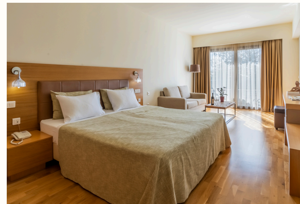
6 Οικογενειακές Executive Σουίτες