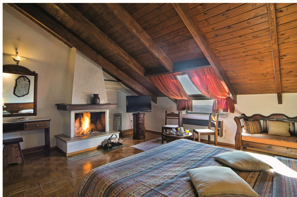
5 Οικογενειακά Chalet