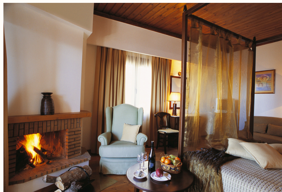
12 Mini Chalet Σουίτες