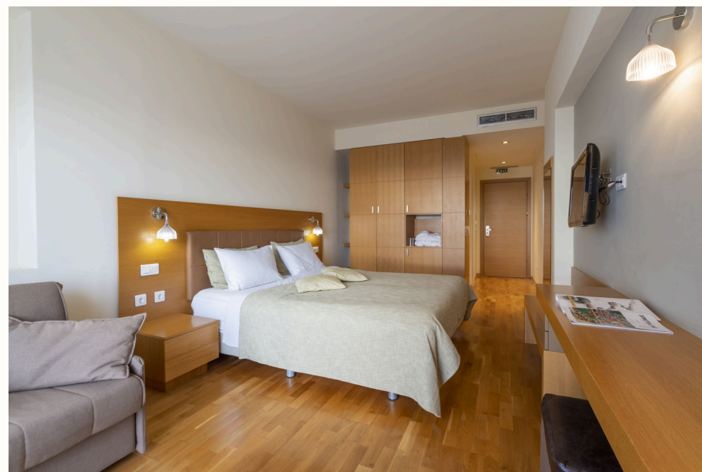
17 Executive Δωμάτια