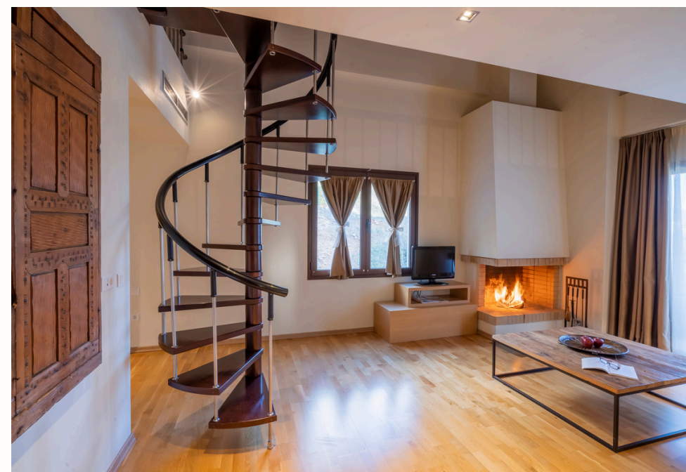
3 Executive Σουίτες