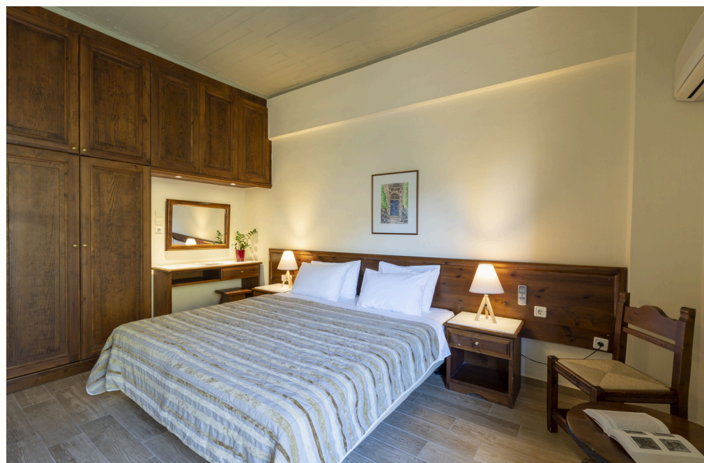
60 Standard Δωμάτια