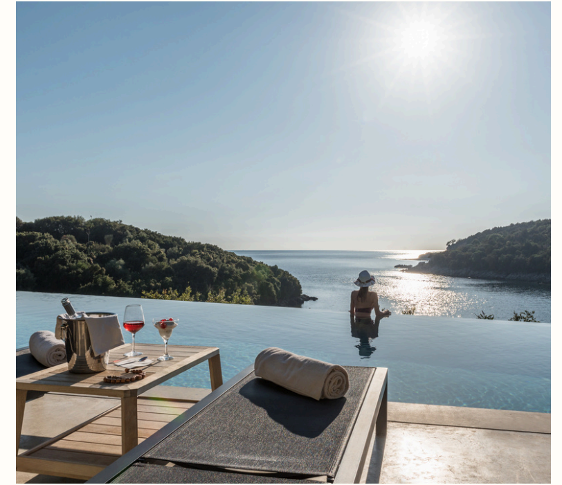
11 2-Bedroom Σουίτες με θέα τη θάλασσα