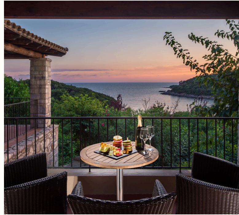
15 Σουίτες με θέα τη θάλασσα