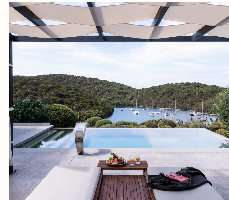
3 Executive Junior Suites με ιδιωτική πισίνα και με θέα τη θάλασσα