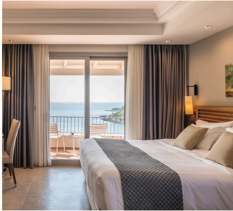
11 Superior Δίκλινα Δωμάτια με θέα τη θάλασσα