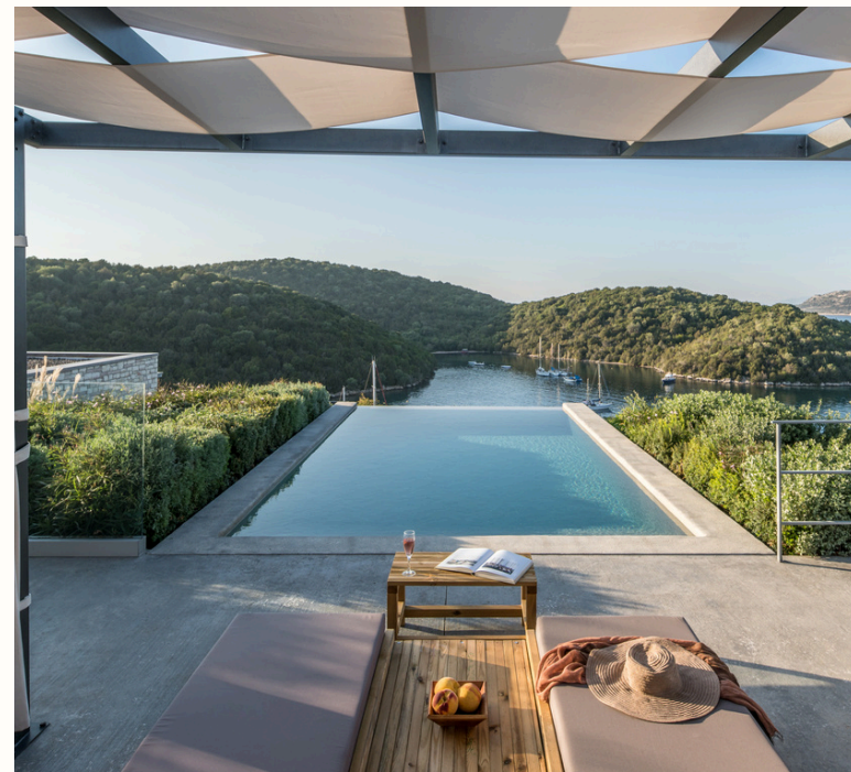
6 Junior Σουίτες με ιδιωτική πισίνα