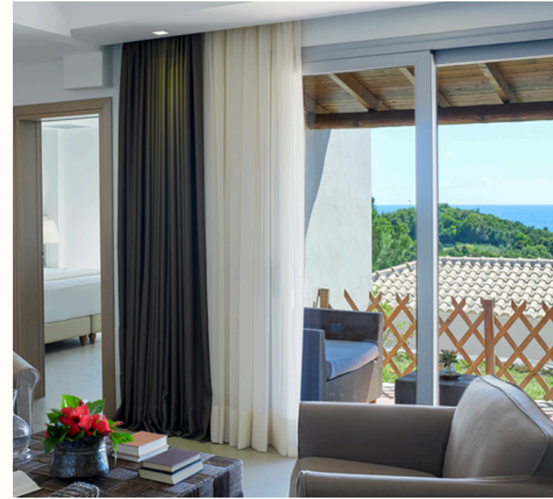
2 Σουίτες με θέα τον κήπο