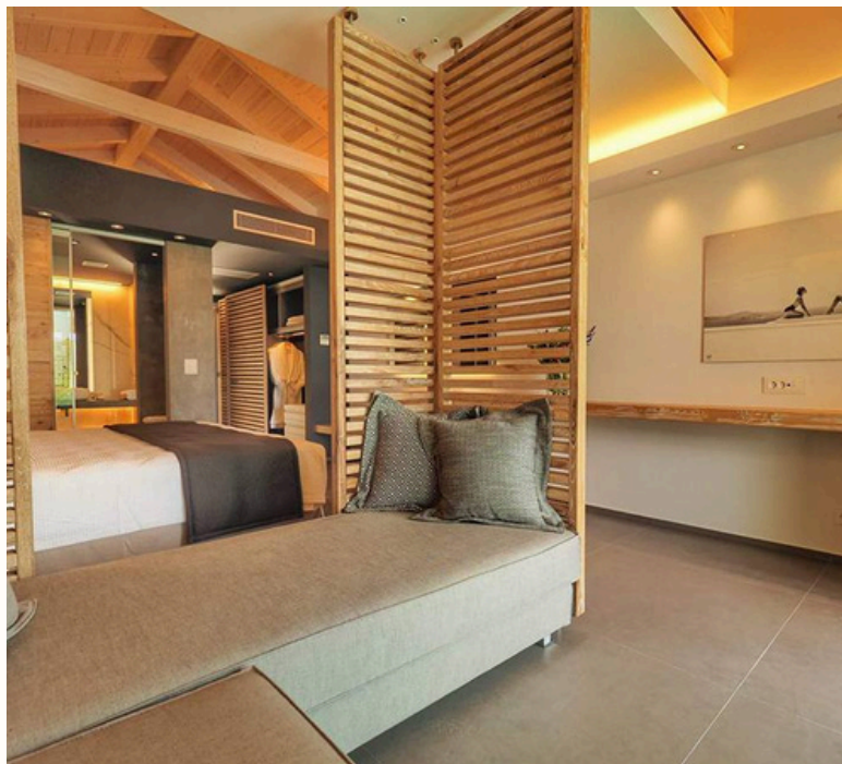
18 Junior Σουίτες με θέα τη θάλασσα